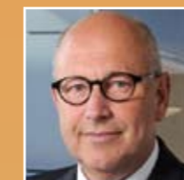
Keynote spreker Roelf de Boer Algemeen Voorzitter RAI Vereniging Voormalig Minister Verkeer & Waterstaat en Vice-Premier – Kabinet Balkenende I

Schrijf gratis in op www.fleetmanagement.nl